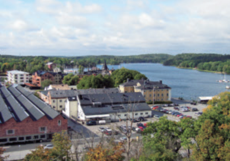
Vy från Kvarnberget över del av fabriksområdet och Farstaviken.