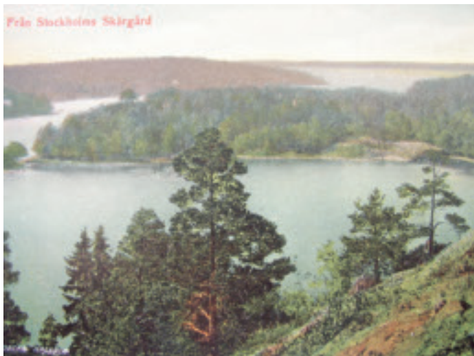
Vykort från tidigt 1900-tal med vy från Blåsut. Den smala inloppspassagen till Gustavsberg, Farstabrohål, till vänster. Vykort ur Värmdö kommuns arkiv.

Svårighetsgraden att nå utsiktsplatserna anges för varje berg. Terrängen är i de flesta fall starkt kuperad varför tåliga skor rekommenderas. Se upp för branta stup, och undvik att besöka platserna vid blöt väderlek p g a halkrisken. Förutom den sista biten till fots så kan alla utsiktsbergen nås med cykel via vägar och cykelvägar. I texten anges förslag på lämpliga cykelvägar. Kartutsnittet visar på lämpliga stigar till utsiktsplatsen. Inga stigar är dock markerade i fält. Har du tillgång till GPS så anges dessutom koordinater för varje utsiktsberg (rikets koordinatsystem i RT90, 2,5 gon V).