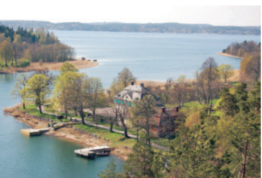
Utsikt från Flaskberget mot Baggensfjärden, Kolström och Beatelund närmast i bild.

Från berget ser man ut över Baggensfjärden. Den skarpögde kan faktiskt se Södersjukhuset rakt västerut genom det sprickdalsstråk som bildas av Lännerstasundet, Järslasjön och Sicklasjön – skärgårdsbornas forna farled till Stockholm. Om man följer Flaskbergets rygg ett litet stycke österut ser man Ingaröbron. På toppen finns resterna av fundamentet till ett utsiktstorn som revs i början på 1960-talet. Tornet var en 50-årspresent till ägaren av Beatelunds säteri, jästfabrikören Sten Westerberg (1884-1956) som förvärvade gården 1923.