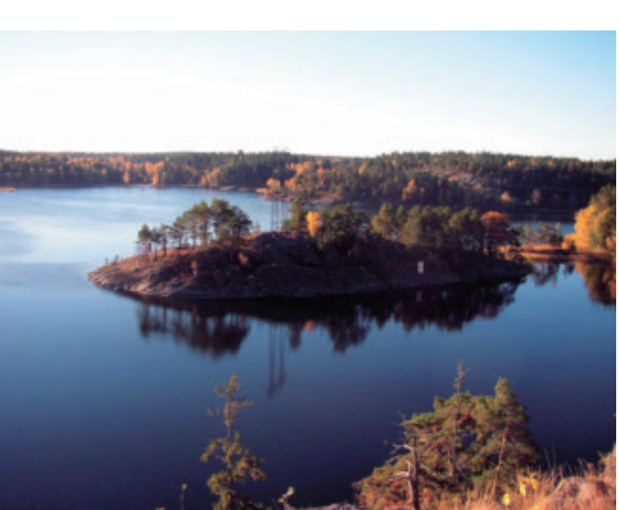
Vy över Getholmen från Fornborgsberget vid Länshaga.