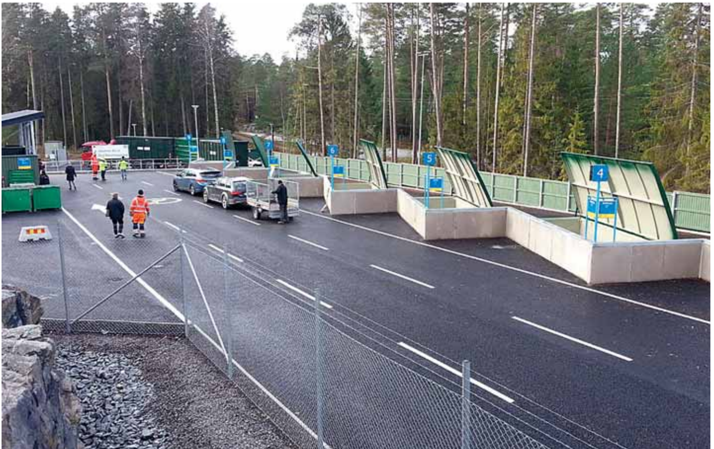
Djurö återvinningscentral (AVC).

Sammanfattningsvis bedöms de negativa konsekvenserna av genomförandet av förslaget till avfallsplan vara små. De positiva effekterna bedöms överstiga de negativa. Avfallsplanens inriktning ligger i linje med en hållbar utveckling och ansluter till nationella miljökvalitetsmål.