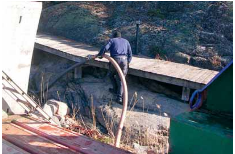
Slamtömning i skärgården.