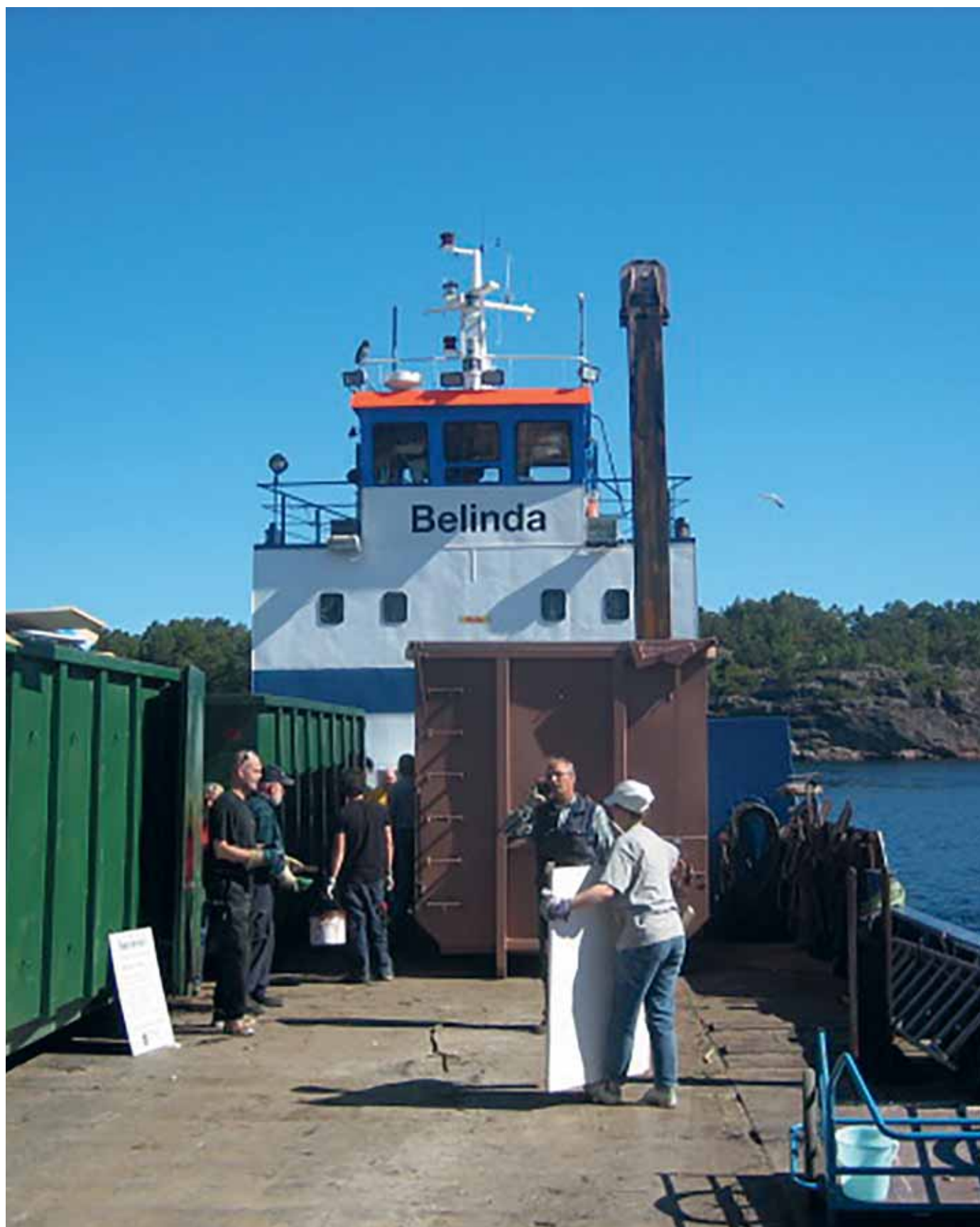
Insamling av grovavfall i skärgården.