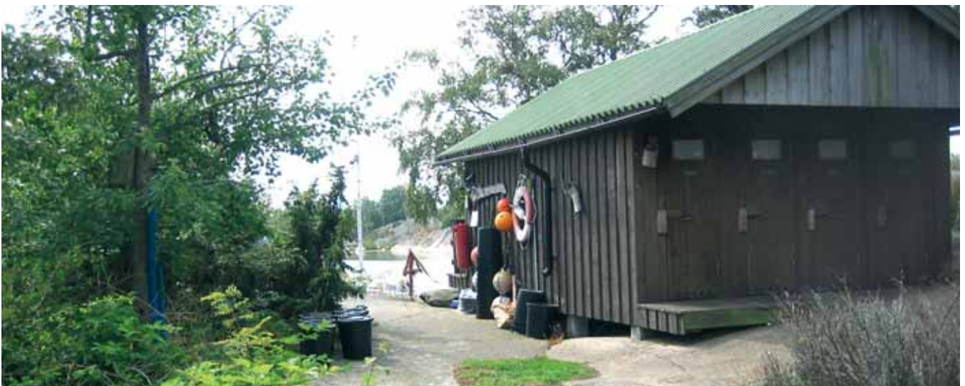
Rent och snyggt är A och O för en bra renhållning