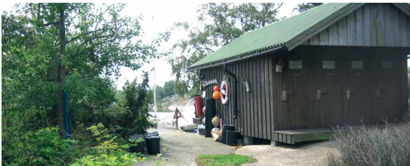
Rent och snyggt är A och O för en bra renhållning