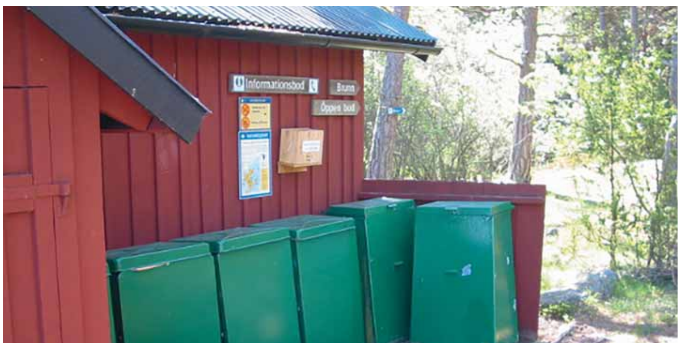
Bod för sopor och toaletter i naturhamn

Löpande = Görs inom ramen för pågående verksamhet Vid behov = Görs vid behov inom ordinarie verksamhet RT = Renhållningstaxan Anslag = Finansieras med skattemedel över budget