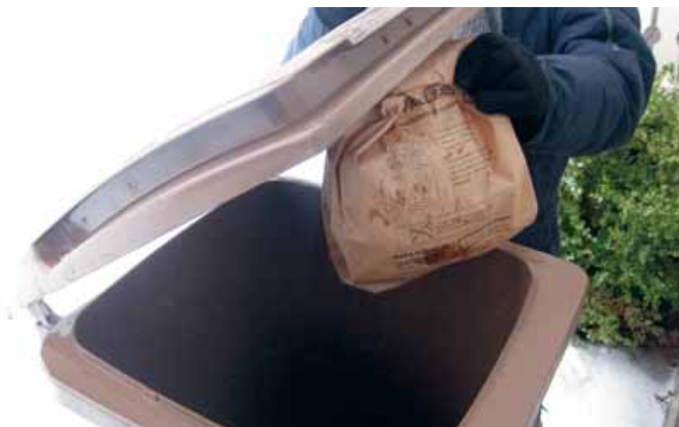
Matavfall går vidare för tillverkning av biogas till bl a fordonbränsle.