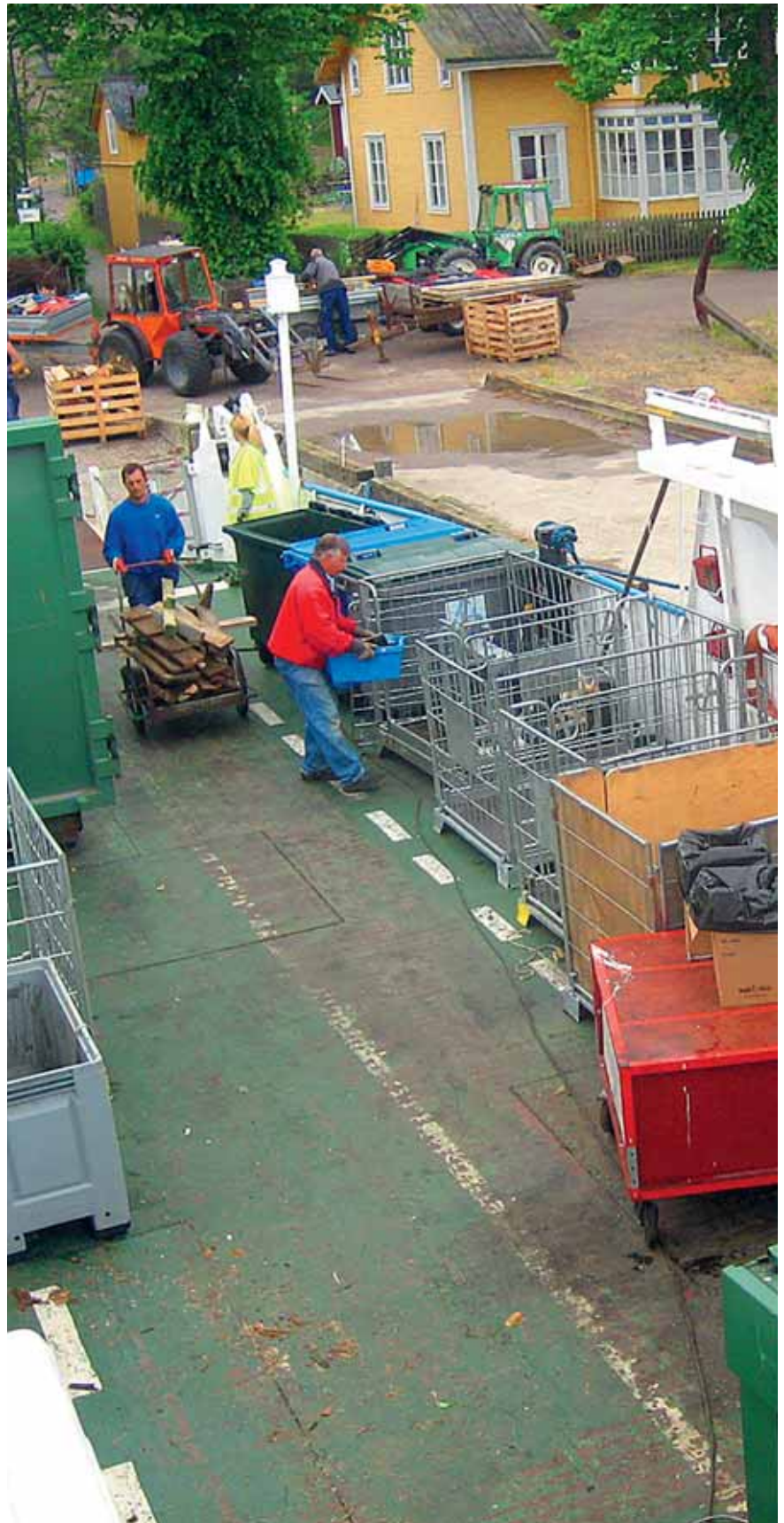
Insamling av grovavfall på Sandhamn.

I Handlingsplan, se sidan 12, redovisas mål, aktiviteter, tider, ansvar samt resurser i tabellform.