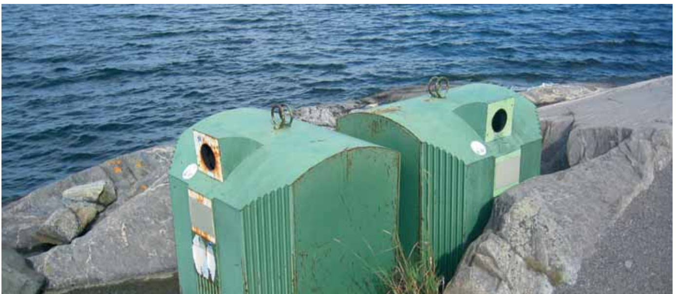
Enkel lösning på återvinning i skärgården

Fastighetsägare och nyttjanderättsinnehavare ska ta hand om sitt avfall i enlighet med avfallsplanen och betala avgift för insamling, transport, återvinning och annan behandling av avfall. De ska vidare sortera och lämna avfall vid ÅVS eller ÅVC som ingår i producentansvaret. Farligt avfall lämnas på miljöstationer eller ÅVC.