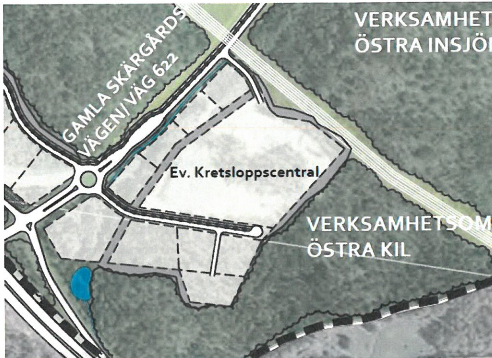
Illustration över området – från Planprogrammet för verksamhetsområde Kil