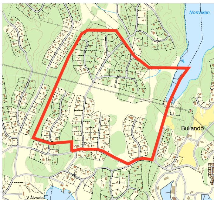
Fig 2, Röd linje - det aktuella planområdets ungefärliga avgränsning