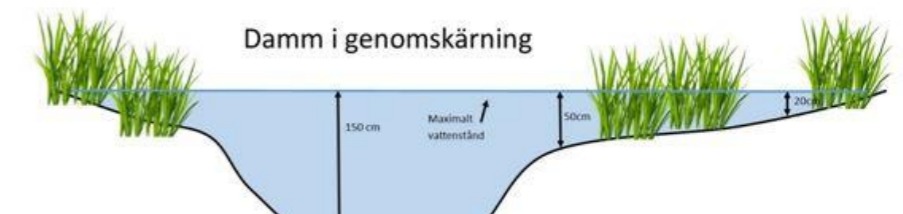
Principskiss på salamanderdammen