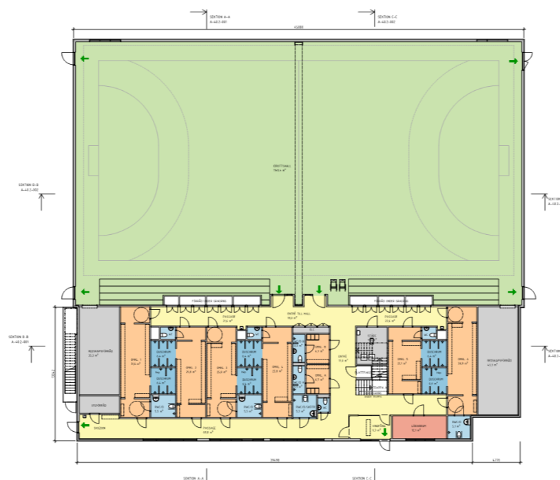
Planritning på idrottshallen från förstudien