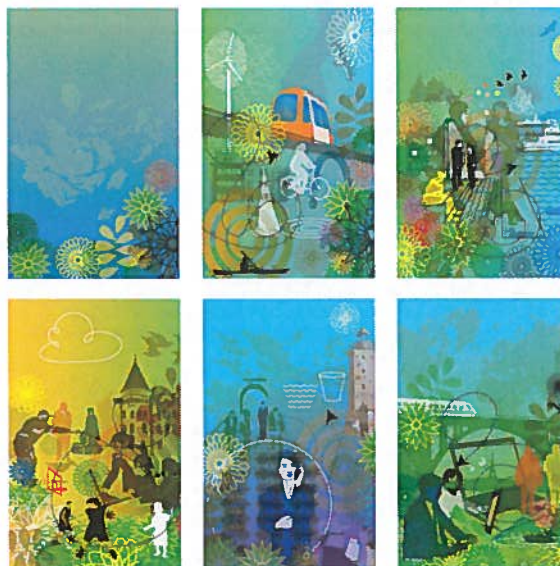
Vision 2030: Skärgårdens mötesplats

Bilderna från Vision 2030 finns tillgängliga på intranätet