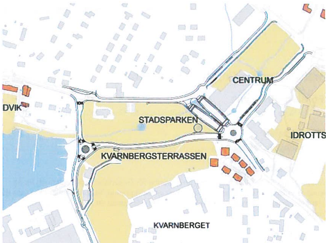
Bild 1: Bilden visar det föreslagna Stadsgatunätet i Gustavsbergs centrum.

Denna rapport redovisar tre möjliga trafiklösningar, av dessa tre alternativ förordas Stadsgatunätet då detta bedöms ha störst potential att uppnå visionen för framtidens Gustavsberg.