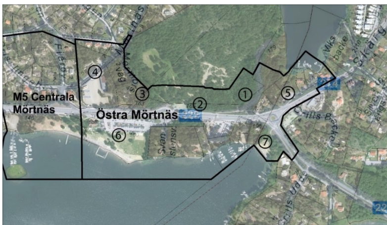
Fig B. Östra Mörtånas, föreslaget planområde.