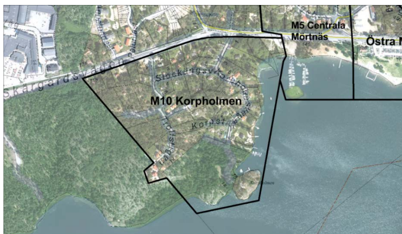
Fig C. Korpholmen, föreslagen planavgränsning.

Korpholmen är ett prioriterat förändringsområde/PFO-område med ett 50-tal fastigheter som är bebyggda med bostadshus och fritidshus. Fastigheterna närmast väg 222 påverkas av vägtrafikbuller och av kommande breddning av väg 222. Kommunens översiktsplan anger att fastighetsstrukturen i kommunens omvandlingsområden ska bevaras. De smala och branta vägarna i området är också ett skäl till att undvika trafikökning och förtätning av bebyggelsen i Korpholmen. Området behöver planläggas för att reglera storlek på byggrätter, anpassa vägnätet till breddning av väg 222 och för att skydda värdefulla grönområden. Planområdet bör i huvudsak få samma avgränsning som i tidigare start-PM från 2003.