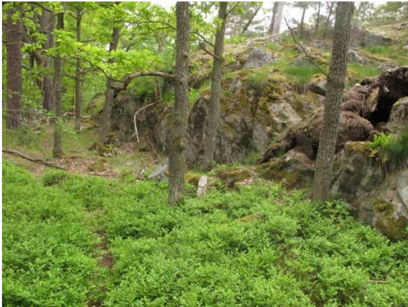
Typisk bild från området med ek-tallskog i småbergig terräng.

Vegetationen i området är typisk för oligotrofa marker på ett underlag av sura berg- och jordarter. Blåbär, lingon och smalbladiga gräs är vanliga i talldominerad terräng medan örterna, främst liljekonvalj, vitsippa och gökärt uppträder där marken är bevuxen med lövträd. En mer avvikande vegetationstyp är lodytor av silikatberg med en varierad flora av olika lavar, mossor och ormbunkar.