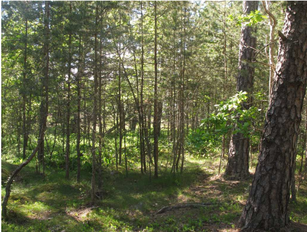
Ung tallskog växer upp under tallarna och bör röjas bort.

Ek och tall är ljuskrävande träd och måste för långsiktig överlevnad säkras mot igenväxning och beskuggning av omgivande träd och buskar. Träden kan också konkurrera med varandra och då skall i regel det äldsta trädet sparas, såvida det är i livskraftigt skick. Bärande träd sparas liksom avvikande trädslag som kan bidra till mångformigheten i området. Död ved är en stor bristvara i skogslandskapet. Därför ska död ved i form av stående torrträd, lågor och grenar sparas. Stigar ska hållas rena från gallringsavfall och nedblåsta stammar och grenar. Allmänheten ska informeras om vikten av att spara död ved.