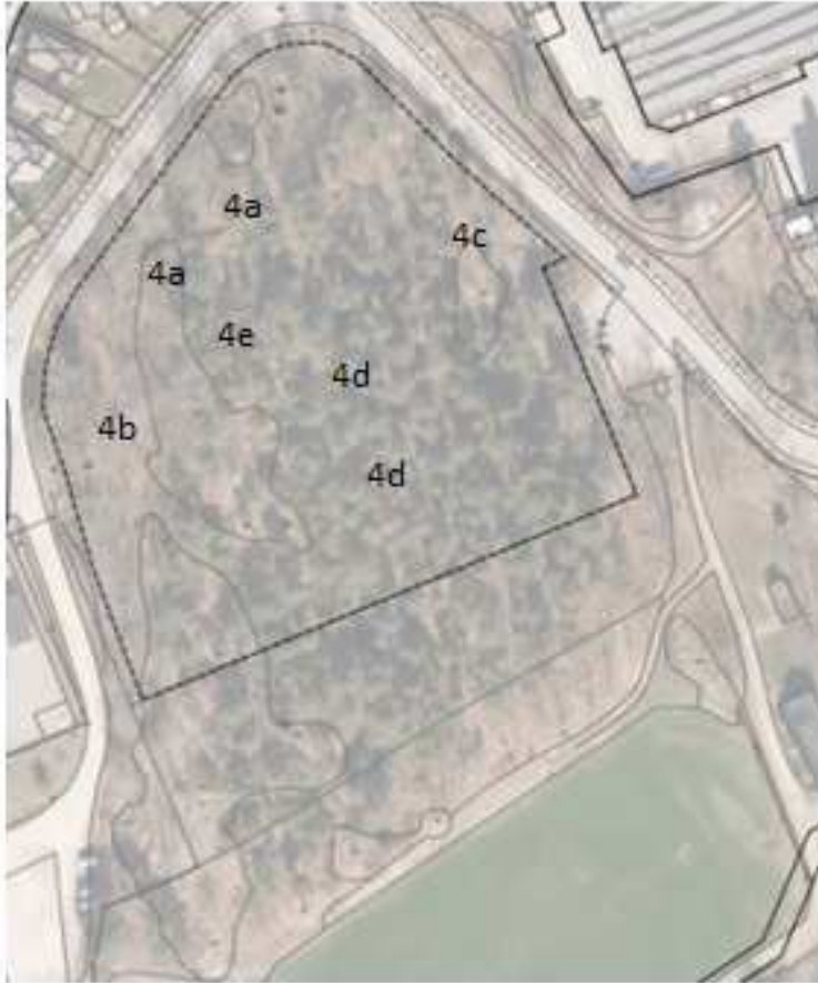
Karta – skötselåtgärder

4e. Ett aspbestånd finns vid 6580398-1646642, vid västra sidan av platån. Det består av ett 50-tal ännu relativt klana stammar. Låt fem av dessa aspar utvecklas till stora träd för att på sikt bidra till den biologiska mångfalden i området.